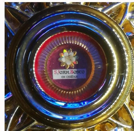
Zdjęcie relikwiarza z naszego parafialnego relikwiarium.

Cały wolny czas Jan poświęcał na pisanie i propagowanie dobrej prasy i książek. Początkowo wydawał je w drukarniach turyńskich. Od roku 1861 posiadał już własną drukarnię. Rozpoczął od wydawania żywotów świętobliwych młodzieńców, by swoim chłopcom dać konkretne żywe przykłady i wzory do naśladowania. Od roku 1877 dla wszystkich przyjaciół swoich dzieł zaczął wydawać jako miesięcznik, do dziś istniejący, Biuletyn Salezjański. Wszystkie jego pisma wydane drukiem to 37 tomów. Ponadto pozostawił po sobie olbrzymią korespondencję.